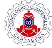
Fundación Universitaria Tecnológico de COMFENALCO (Colombia)