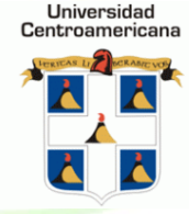
Universidad Centroamericana (Nicaragua)