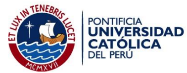
Pontificia Universidad Católica del Perú