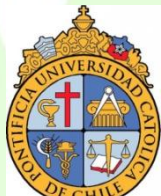
Pontificia Universidad Católica de Chile