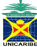
Universidad del Caribe (República Dominicana)